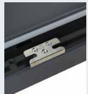
Zoom gâche fourchette