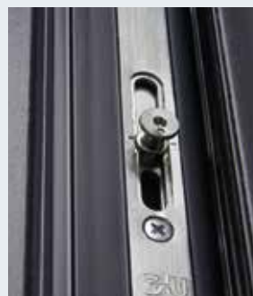
Zoom galet champignon